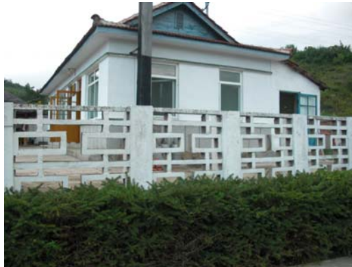
延辺の都会・農村の高齢者利用施設（認知症専門病院・活動室・省老人ホーム）