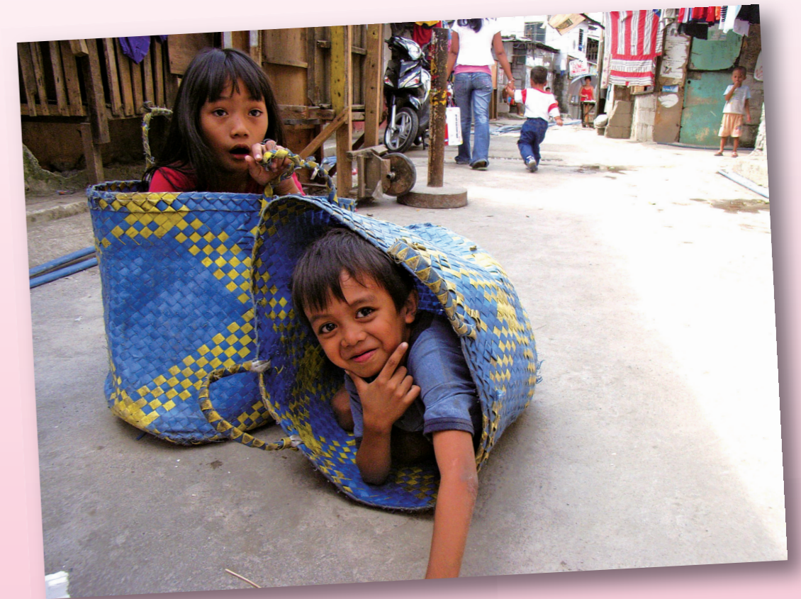
京都大学グローバル COE 「親密圏と公共圏の再編成をめざすアジア拠点」 Global COE for Reconstruction of the Intimate and Public Spheres in 21th Century Asia