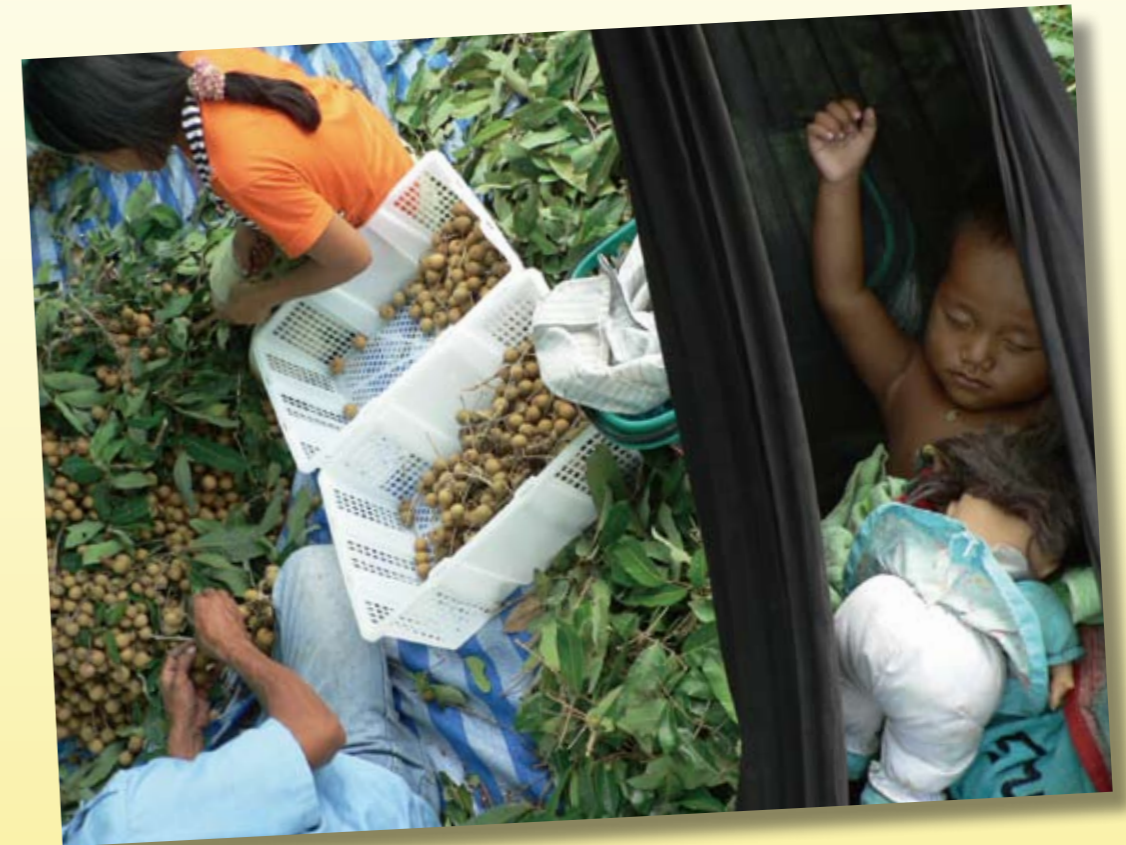
京都大学グローバル COE 「親密圏と公共圏の再編成をめざすアジア拠点」 Global COE for Reconstruction of the Intimate and Public Spheres in 21st Century Asia